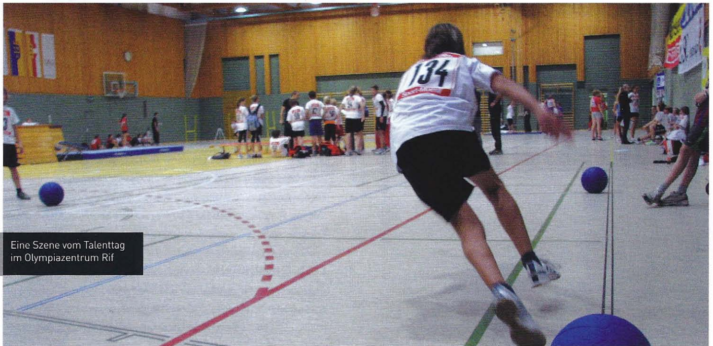
Eine Szene vom Talenttag im Olympiazentrum Rif